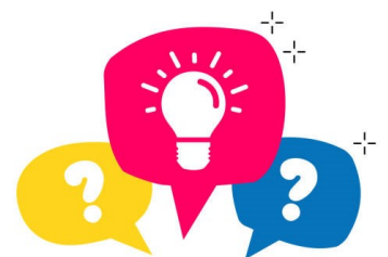
Rätsel: N. Balaur

(Lösung in der nächsten Ausgabe des Newsletters)