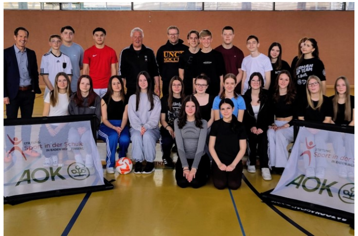
Text & Foto: M. Gruber

Mit dem Ziel, Bewegung, Gesundheit und Gemeinschaft zu stärken, zeigte „Score-a-Goal!“, wie Fußball auch außerhalb des traditionellen Wettkampfgedankens in den Schulalltag integriert werden kann. Die Workshops kamen bei den Jungs und Mädchen hervorragend an und boten zahlreiche neue Impulse für den Schulsport.