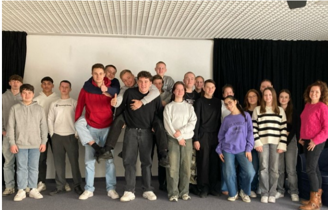
Text: & Foto K. Kipp