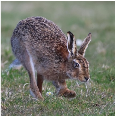
Witze: L. Weigold