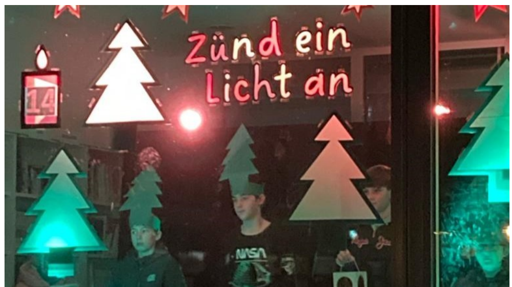
Weihnachtsaktion „Lebendiger Adventskalender“